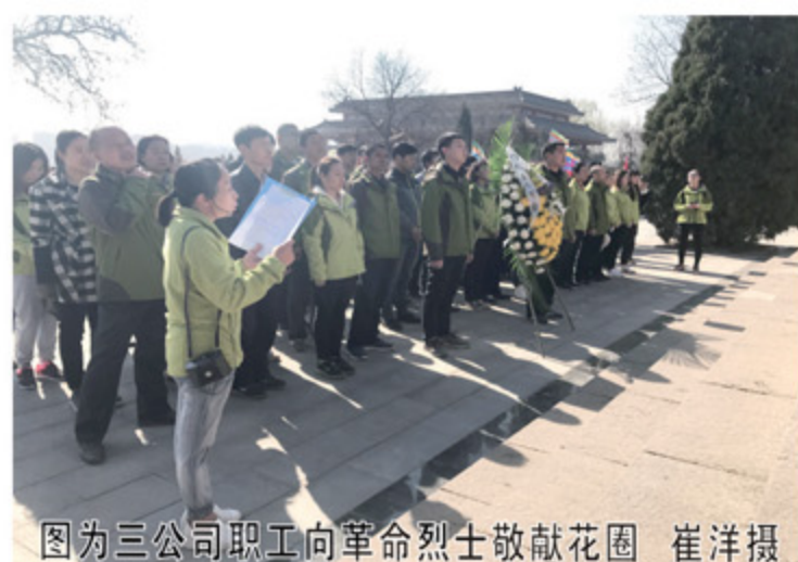
图为三公司职工向革命烈士敬献花圈

一项目部组织青年职工在健康西路项目部开展了“诵读经典 缅怀先人”主题活动，通过诵读经典诗文，表达对先贤的无限缅怀和敬仰。物业公司、安装公司组织党员前往支前精神红色教育基地阳曲县店子底村进行了参观学习。四公司、建筑公司、通途市政工程处组织职工利用网络、微信等平台，通过在网祭扫、献花、寄语留言等方式，追思革命先烈，传承民族精神。大家纷纷表示，一定要铭记历史，牢记使命，继承和发扬革命先辈的优良传统，立足本职岗位为企业发展做贡献。